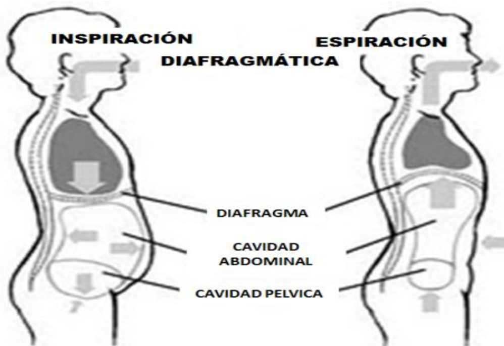
FIGURA 1. RESPIRACIÓN DIAFRAGMÁTICA

Si se hace consciente de que está respirando inadecuadamente, para corregirlo realice la siguiente práctica simple y sencilla: acuéstese ; colóquese en atención consciente con una mano sobre el ombligo. Hágase consciente de sus movimientos respiratorios . Expulse todo el aire con una exhalación forzada espichando su globo abdominal. Inspire de manera lenta, suave y profunda, visualizando que el aire se dirige a sus glúteos y el globo en su abdomen se abomba haciendo una pausa de tres segundos. Note como la mano que está sobre el ombligo sube con la inspiración y baja con la espiración . A la tercera inspiración acaricie con su lengua el cielo del paladar, cierre los ojos y mire internamente hacia la frente, sintiendo que se integra a la Consciencia universal . Quédese en ese estado de paz, ejercitándose con persistencia.